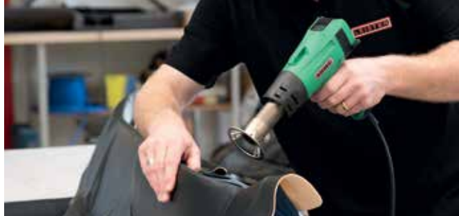
SOLANO AT - Finom bőr alkatrészek biztonságos és hatékony feldolgozása