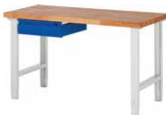
kleines Schubladenelement links