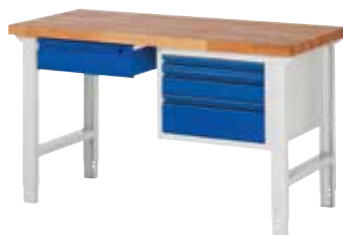
kleines Schubladenelement links, mittleres Schubladenelement rechts