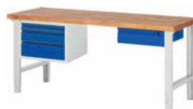
mittleres Schubladenelement links, kleines Schubladenelement rechts