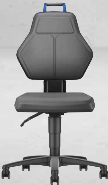
Arbeitsdrehstuhl mit Rollen