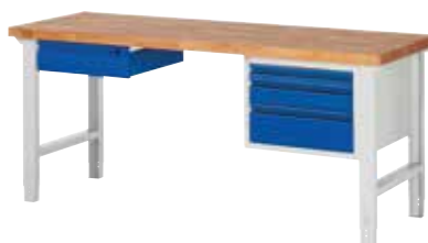
kleines Schubladenelement links, mittleres Schubladenelement rechts