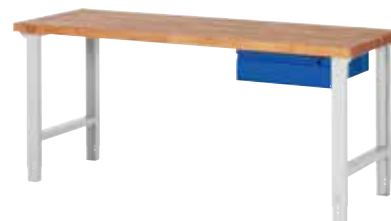
kleines Schubladenelement rechts