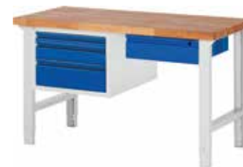
mittleres Schubladenelement links, kleines Schubladenelement rechts