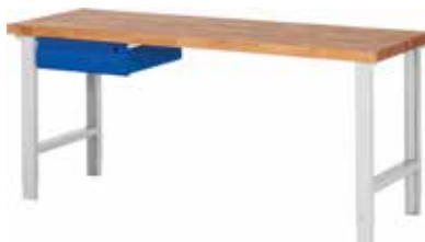
kleines Schubladenelement links