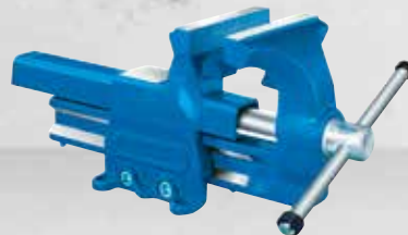
Parallelschraubstock, vier Befestigungsbohrungen