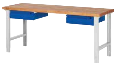
kleines Schubladenelement beidseitig