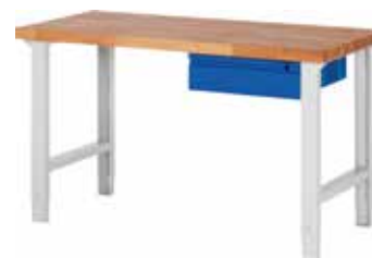
kleines Schubladenelement rechts