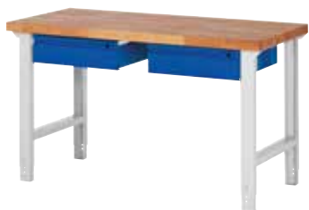
kleines Schubladenelement beidseitig