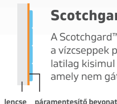
lencse páramentesítő bevonat

A Scotchgard™ páramentesítő bevonaton kisebb a vízcseppek peremszöge, így a folyadék gyakorlatilag kisimul és transzparens filmréteget képez, amely nem gátolja a látást.